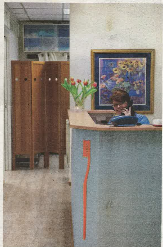
En hyggelig atmosfære ønsker oss velkommen inn på Tannpleieklirikken AS – og oransje tannbørster.

Les Vestfold Blad på nett www.vestfoldblad.no